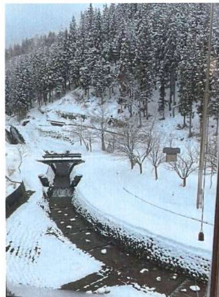
雪国なので露天ではありませんが眺めの良いお風呂ついています。